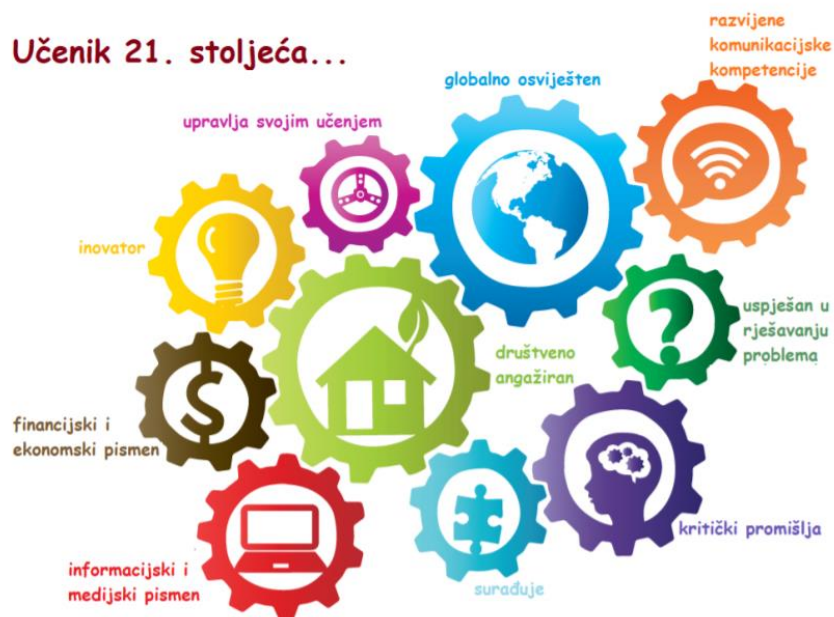
Slika 2. Znanja i vještine koje se očekuju od učenika 21. stoljeća i prema čijem razvoju je nužno usmjeravati strategiju internacionalizacije

Takav će se nastavnik uspješno nositi sa svakodnevnim promjenama i posljedica njegovog djelovanja je neminovno i osposobljavanje učenika 21. stoljeća.