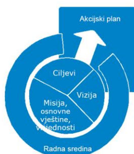
Slika 1. Sastavnice strateškog planiranja

Pri izradi strategije u obzir treba uzeti različite kontekste – nacionalni, europski, tržište rada, lokalne potrebe i globalne probleme i smjer razvoja.